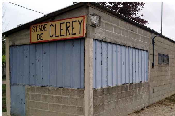
L'ancien bâtiment qui date de 1964 reste en place.