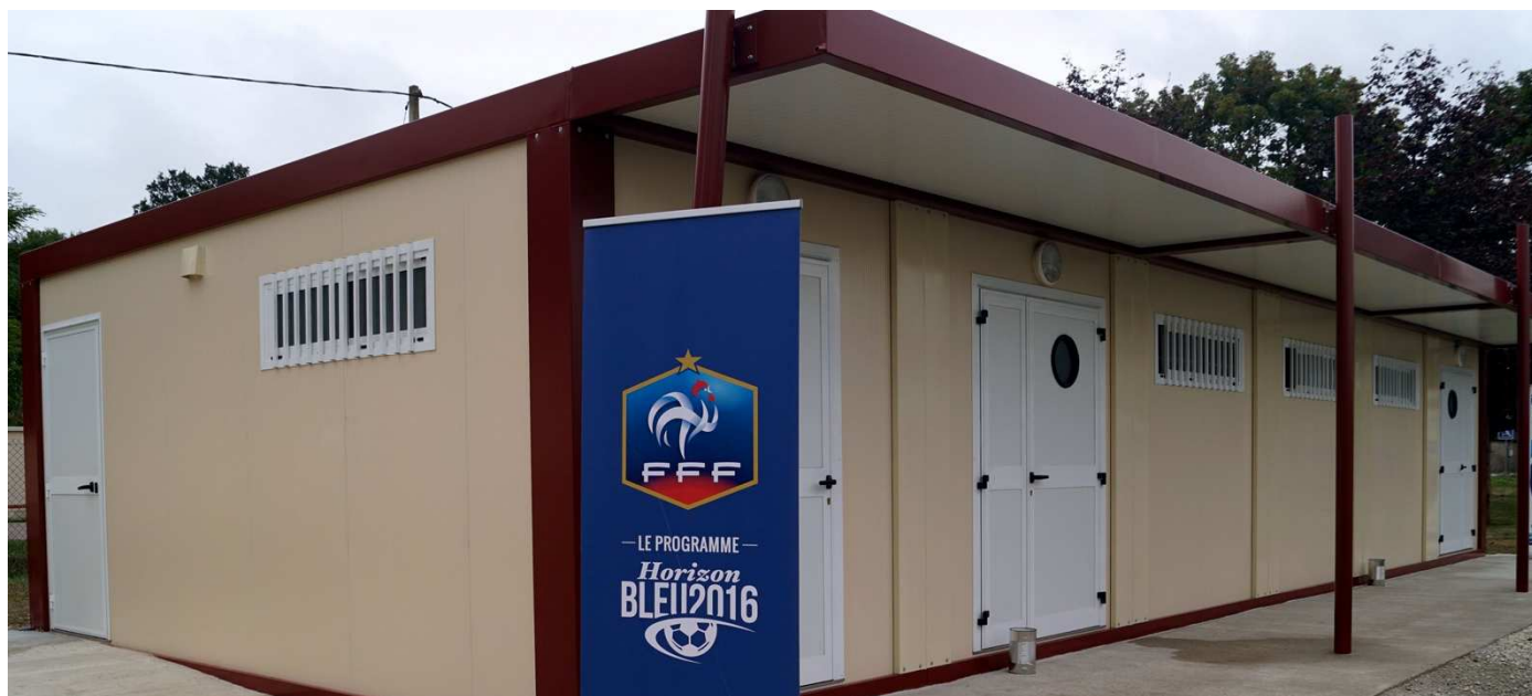
L'Association Sportive et Culturelle Fresnoy-Clérey est dorénavant dotée de vestiaires flambant neuf.