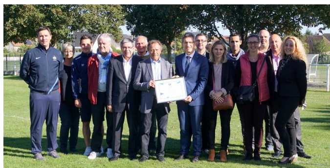
Le FCAT et fier d'avoir reçu cette récompense fédérale.

Depuis le 1 er septembre 2016, et pour la deuxième saison, le « Label jeunes FFF » est déployé par la Fédération sur l'ensemble du territoire afin de renforcer la notion de « Projet club » et de récompenser les clubs les plus méritants en matière de structuration et de développement. Le « Label jeunes » représente une véritable distinction nationale. Le FCAT avec ses 680 licenciés, dont 400 enfants de l'école de foot, fait partie des critères imposés pour obtenir cette récompense.