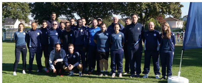
Les éducateurs du club ont apprécié cette récompense.