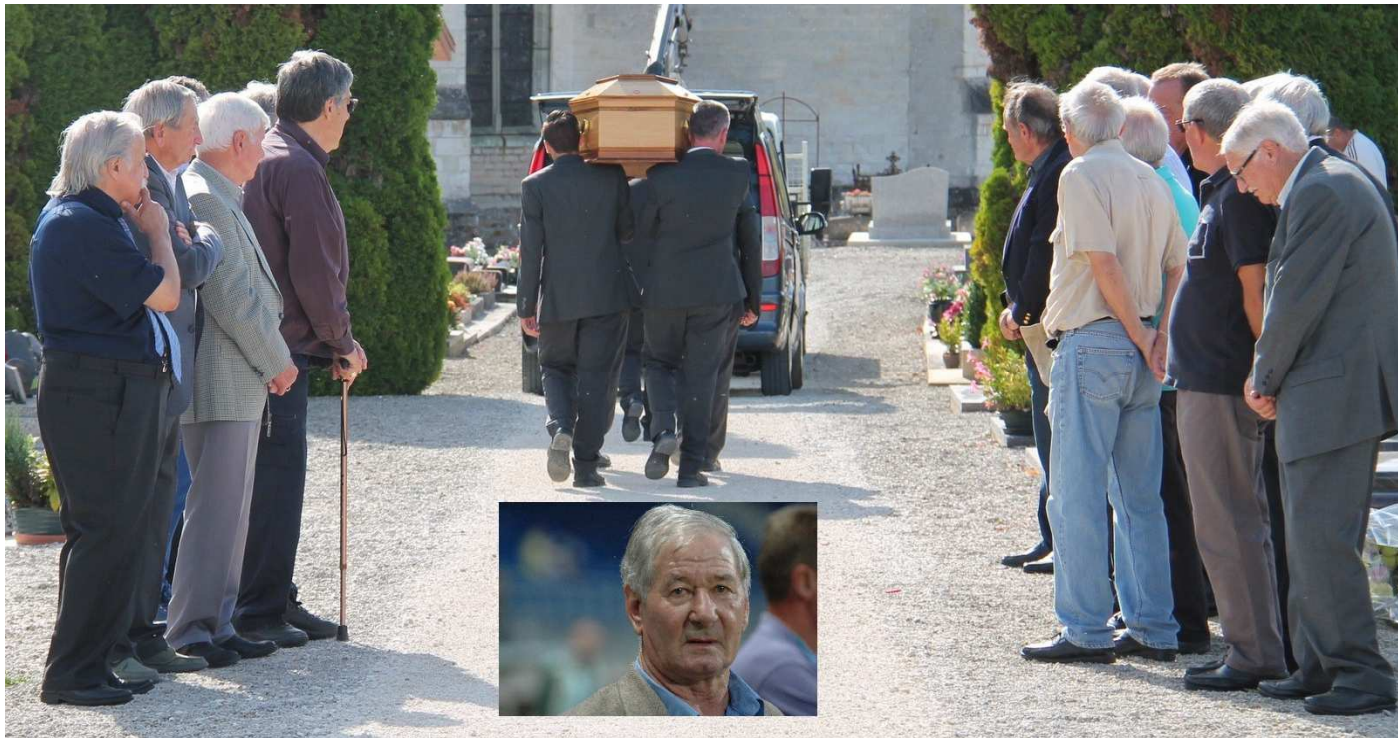
Une haie d'honneur des anciens de l'ASTS et du TAF au passage du cercueil de Marcel Artelesa.

Mercredi 28 septembre, il y avait beaucoup de monde au cimetière de Mergéy, surtout des anciens footballeurs venus rendre un dernier hommage à Marcel Artelesa décédé quelques jours auparavant, à l'âge de 78 ans. International à 21 reprises, Marcel porta à 9 reprises le brassard de capitaine de l'équipe de France et disputa la Coupe du Monde en 1966 en Angleterre.