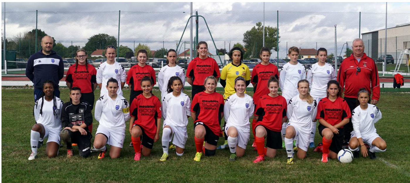
L'U.S Dienvilloise (en rouge) et l'Estac participent au challenge régional U18 de foot à 8.

Le challenge régional U18 féminin de foot à 8 est reparti depuis un mois. Ce « championnat » comporte dix équipes : Estac, Dienville, Saint-Memmie, Stade de Reims, Aube-Sud-Vanne, Maranville-Re-nepont, F.C Agglomération Troyenne,