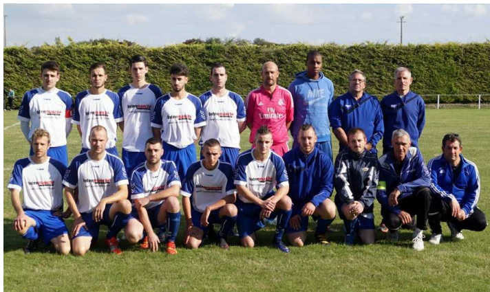
L'équipe de 3 Vallées est un groupe solide.