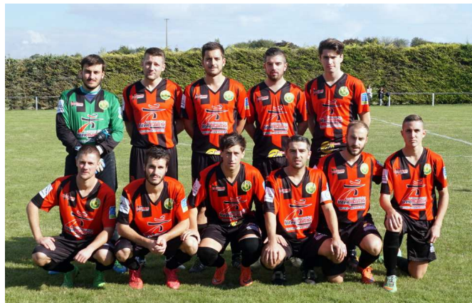
Rosières est actuellement à 1 point du leader.