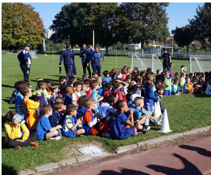
Les jeunes footballeurs attendent devant le podium.