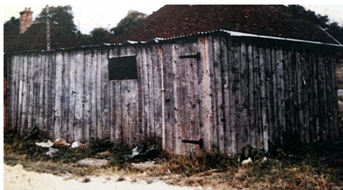
Les premiers vestiaires construits en 1954.