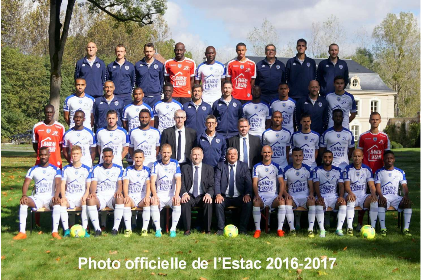
Photo officielle de l'Estac 2016-2017

Site internet : http://district-aube.fff.fr