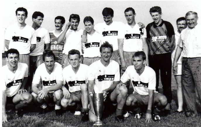
1989 : vainqueur de la finale de la Coupe de l'Aube avec l'US Vendeuvre.