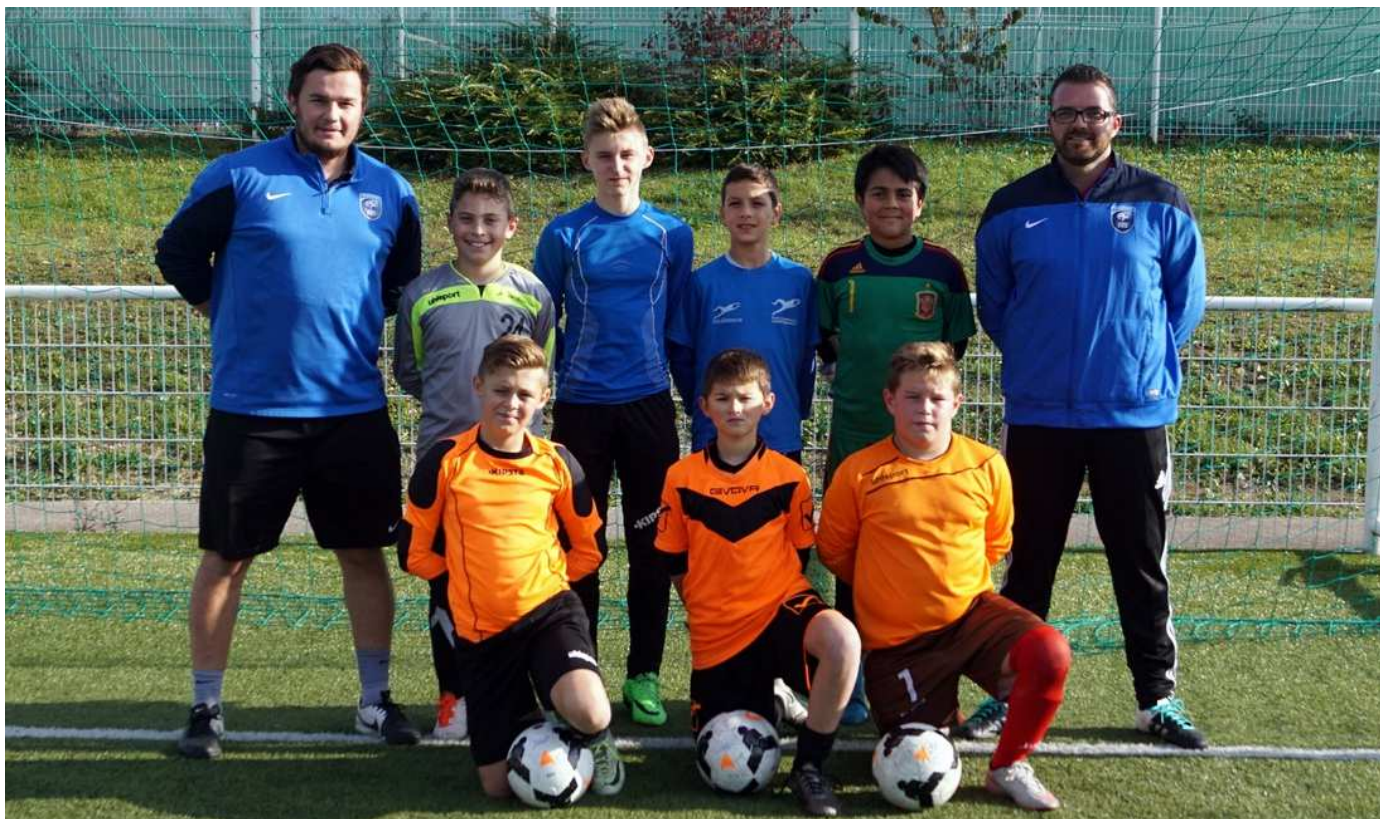
Les gardiens de but U13 Excellence et leurs formateurs.