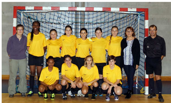
Une équipe de filles était présente à ce tournoi.