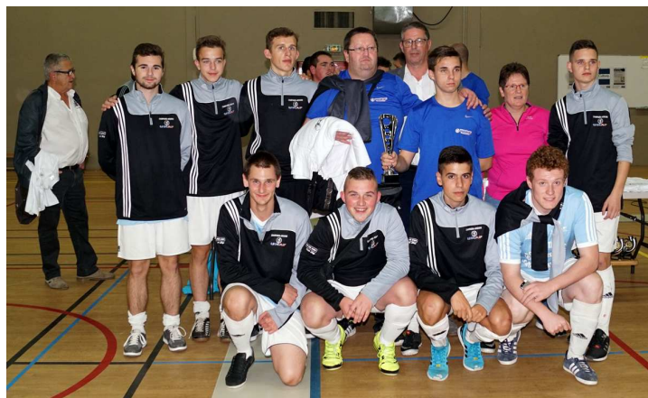
La Champagne-Ardenne a terminé à la 4 ème place.