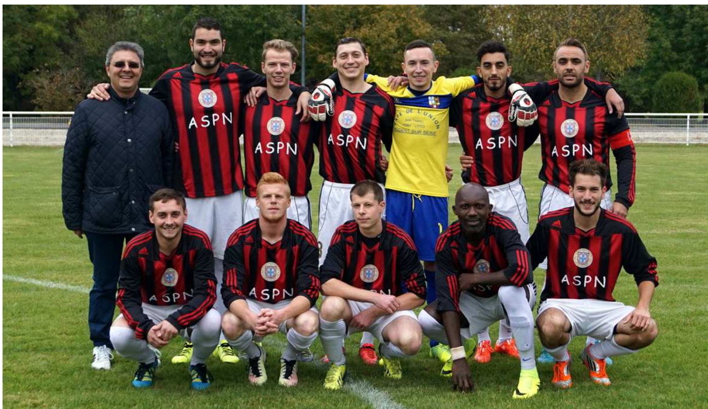
L'équipe 1 des Portugais de Nogent est dans le championnat de 1 ère Division de district.