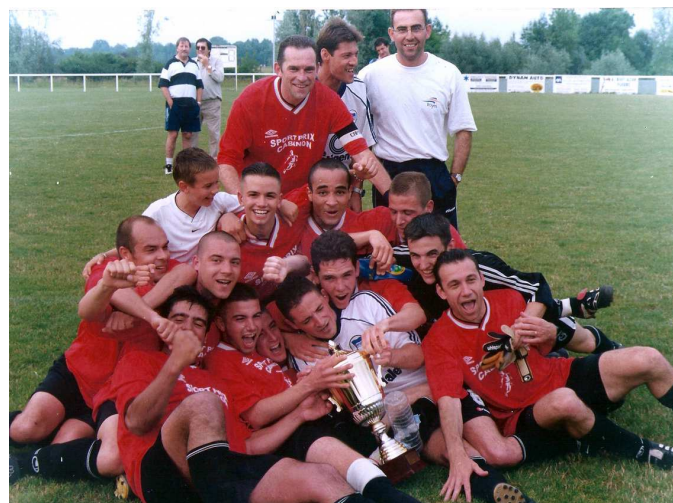
En 2002 avec les Municipaux de Troyes lors de la finale de la Coupe de l'Aube.