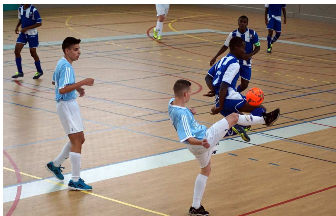
De belles actions de jeu durant les deux jours.