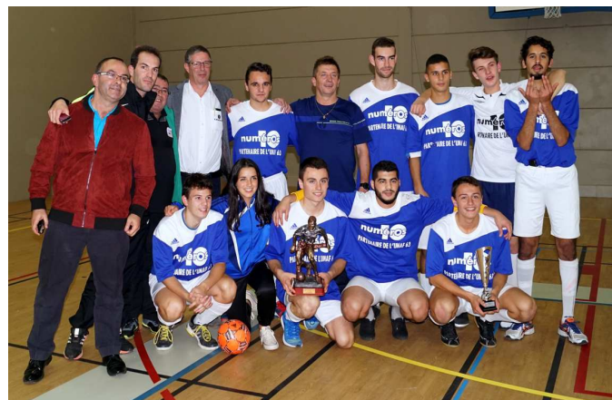
Les Auvergnats vainqueurs de Paris Ile de France.

La 8 ème édition du Challenge futsal Louis Tereygeol, du nom de celui qui créa l'Union Nationale des Arbitres de Football (UNAF) en 1967, a eu lieu au cosoc 2 et 3 de Troyes du 29 au 30 octobre. Plus de 250 jeunes arbitres, dont une équipe de filles, ont participé à cette manifestation sportive. Venu de toutes les régions de la métropole et de l'Outre-Mer (Mayotte et la Martinique),