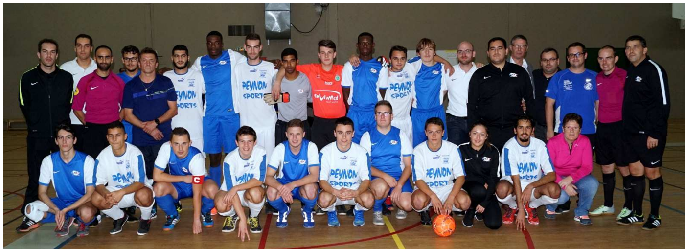
Les finalistes et les arbitres ont posé pour la photo souvenir avant de passer aux choses sérieuses.