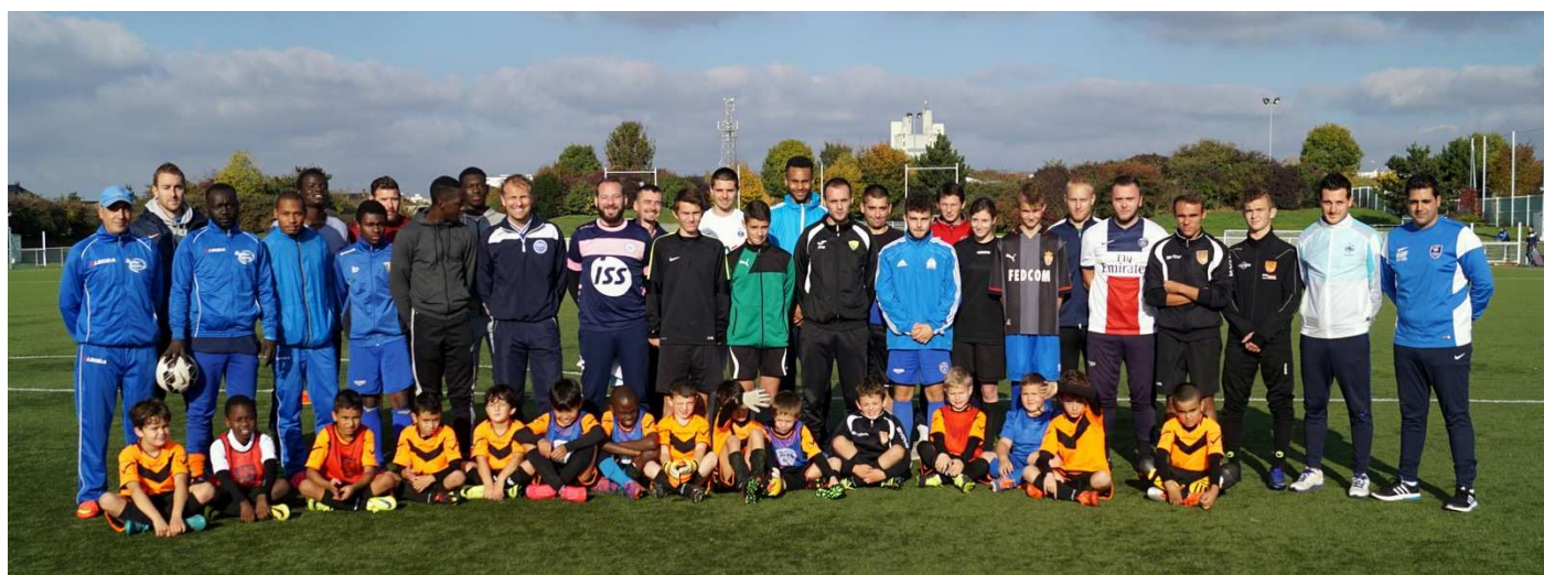
Un stage qui permettra aux licenciés de bien s'occuper des équipes U9-U11.