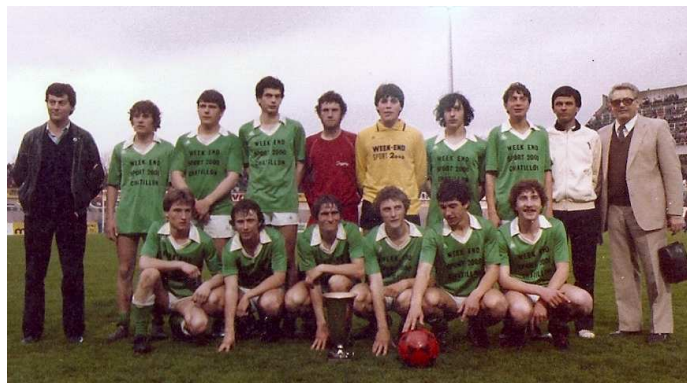
Vainqueur de la Coupe Ruffier avec Mussy, en 1982.

Nancy, Metz, Paris... mais mon père, à juste titre à l'époque, plaçait les études en priorité par rapport au football. Les temps ont bien changé aujourd'hui, j'ai l'impression que les études sont protégées si on tente le chemin du football professionnel. L'apothéose de cette période fut la finale de la Coupe Ruffier, consolante de la Gambardella, la coupe de France juniors. La finale s'est déroulée au Stade Auguste-Delaune, en levée de rideau d'un match du Stade de Reims. Nous avons battu Sainte-Anne de Reims 7-0. Il y avait plus de 400 Musséens au stade, venus en cars ou en voitures... Que la nuit fut longue !