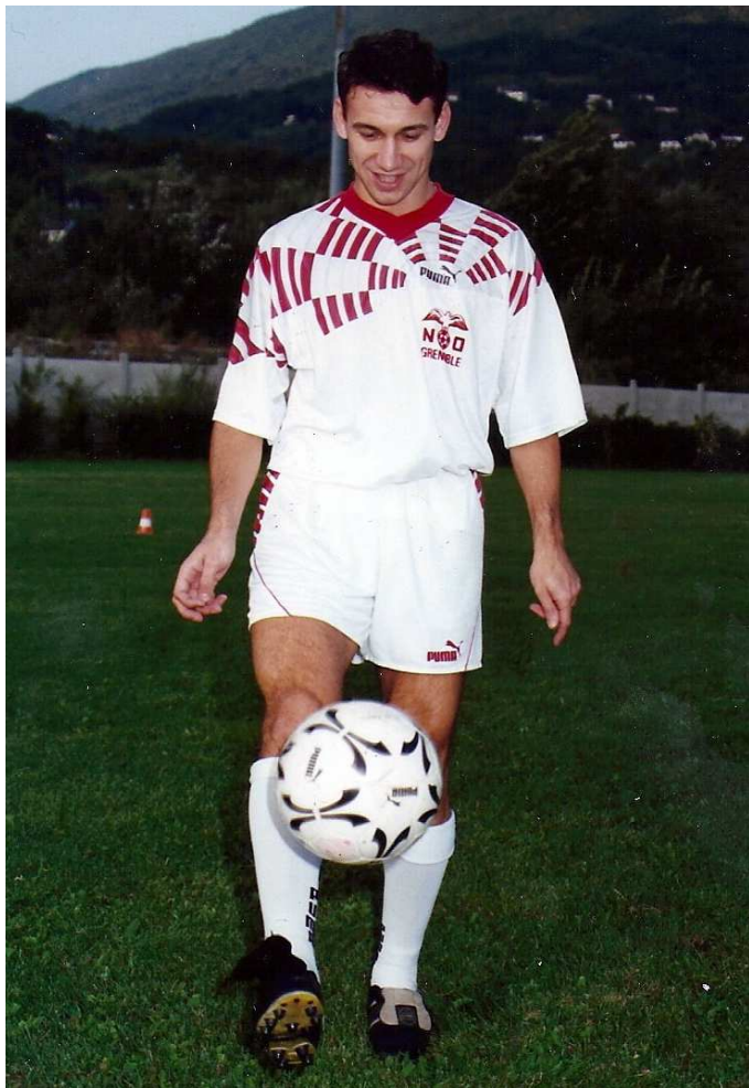
Meilleur buteur du Nordcap Grenoble, en 1993.