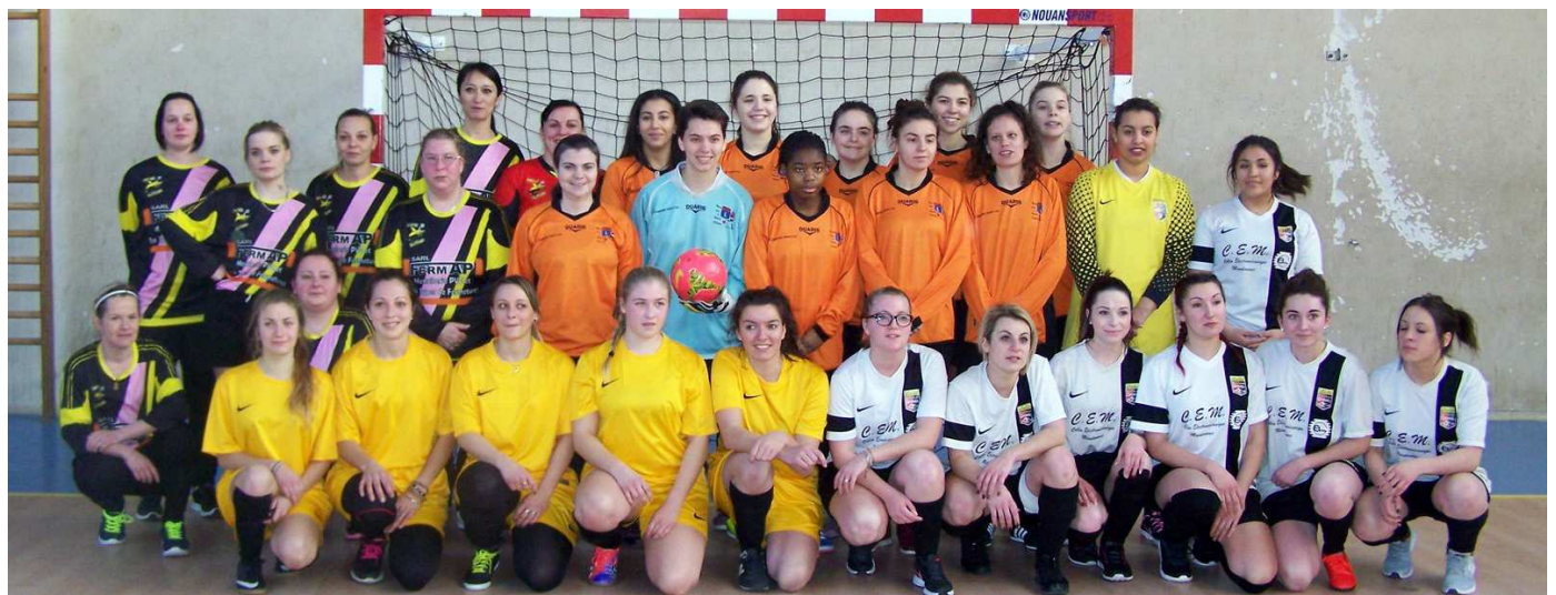
Les participantes de la seconde phase du challenge.

La seconde phase s'est déroulée le 22 janvier, au même endroit. C'est le RCSC qui a terminé à la 1 ère place devant Lornel (52), le Foyer Bayart (52) et Bar-sur-Aube. Le 3 ème tour se jouera le 29 janvier.