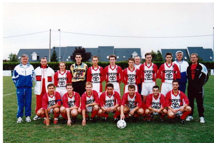
Avec l'équipe de La Rivière-de-Corps (en bas à gauche).