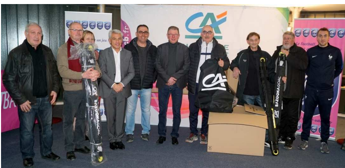
Du matériel pour les lauréats du Mozaïc Foot Challenge.

Par la même occasion, d'autres équipes ont reçu du matériel d'entraînement dans le cadre du « Mozaïc Foot Challenge ». Il s'agit de Crenoy (U15), Estac (seniors féminines), Rosières (U17), FC Nogentais (U13), RS 10 (U19) et Chesterfield (seniors). Aucun représentant de ces deux dernières équipes n'était présent.