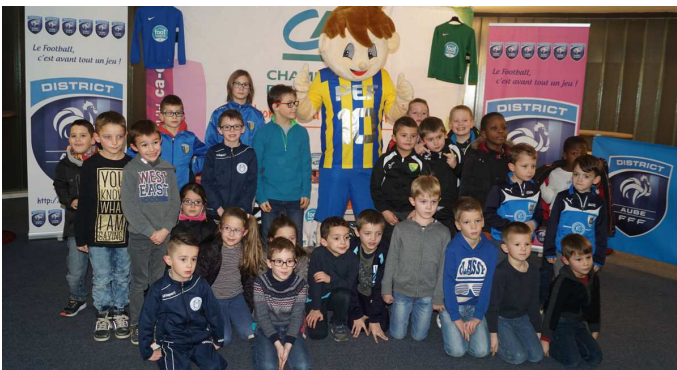
La mascotte du district était présente avec les jeunes.