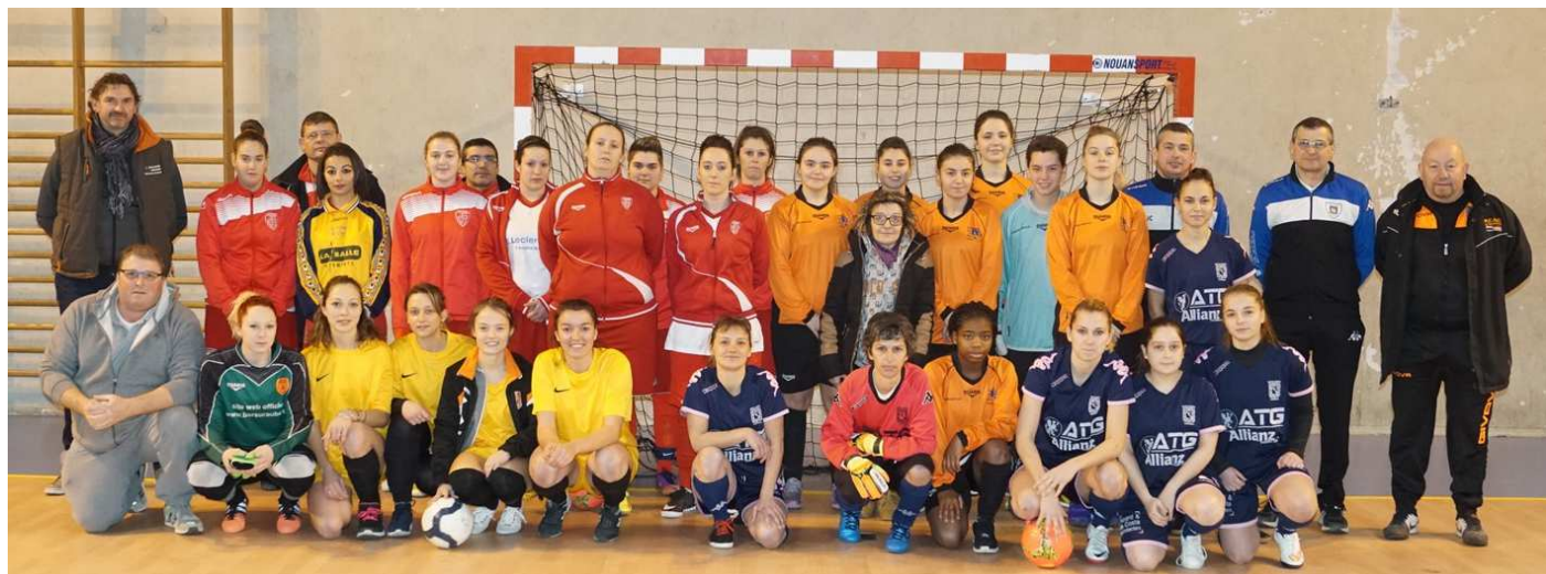
Les quatre équipes de filles avant le début de la compétition.