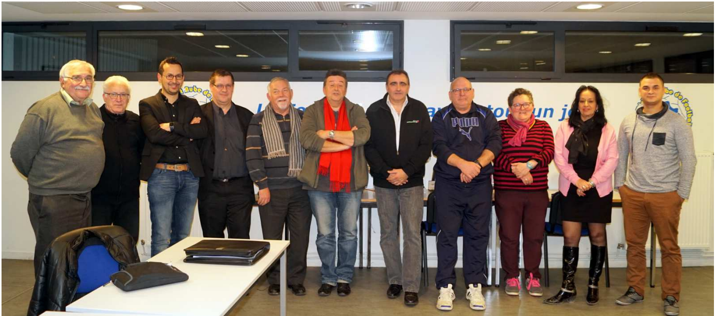
Le délégué doit être fédérateur au sein d'une rencontre de football et le coordinateur de tous les acteurs.

Tout le monde connaît avec plus ou moins de justesse le rôle d'un arbitre sur un terrain de football. Mais qui connaît le rôle du délégué officiel, cet homme qui se tient pendant tout le match entre les deux bancs de touche ? Une formation à ce poste a débuté au district.