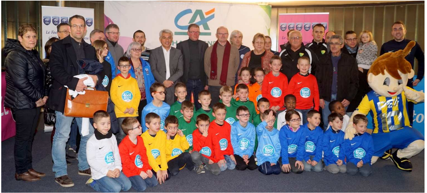
Le Crédit Agricole récompense chaque année pour leur sportivité des clubs ayant des équipes de jeunes.

Lundi 16 janvier, au Centre sportif de l'Aube, 14 clubs aubois ont vu leurs équipes U7/U9 recevoir des maillots du Crédit Agricole Champagne-Bourgogne dans le cadre de l'opération « Graines de Foot ». La saison 2015-2016 a été bénéfique, au point de vue de la sportivité, pour Les Riceys, Stade Villeneuvois, Villenauxe, Foot Seine, Montieramey, Plancy, Portugais de Romilly, ASLO, Arcis, Melda, St-Julien, St-Etienne-sous-Barbuise, Vaudes Animation et Les Chartreux.