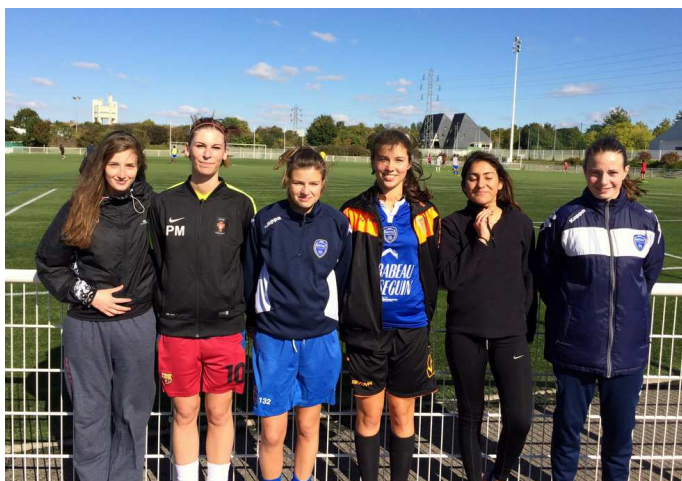
Quatre filles sont licenciées FFF.