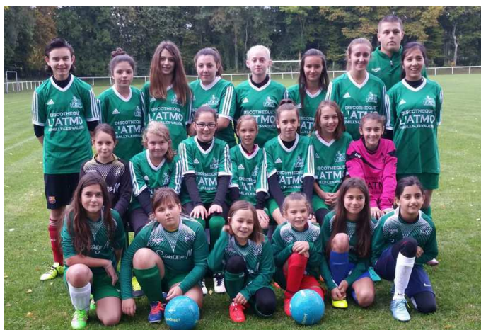
Les jeunes filles de la Vaudoise.

Une étape importante aura lieu le 11 avril 2017 dans le cadre de l'action « Mesdames, franchissez la barrière ». Des plateaux de U6 à U11 seront organisés encadrés par des joueuses adultes. Il ne faut donc pas hésiter à franchir cette barrière et à vous investir Mesdames. Il est terminé le temps où les parents disaient que le football est fait pour les garçons et la danse pour les filles, maintenant tout le monde a sa place dans ce sport. Venez nous rejoindre !