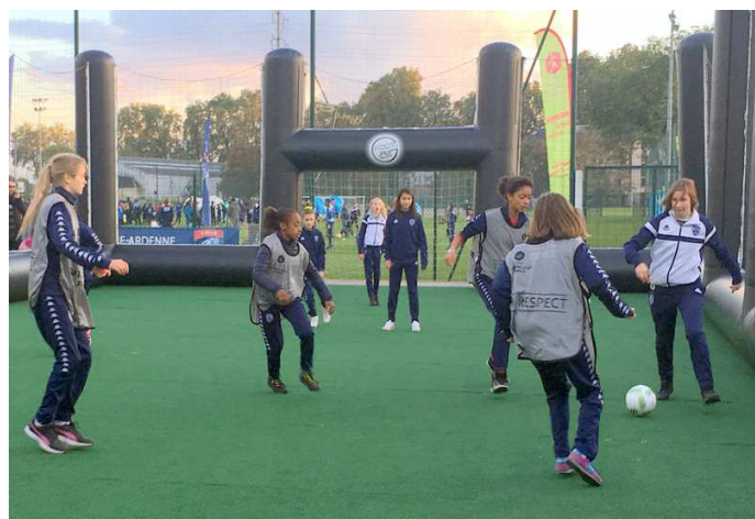
Avant un soir de match au Stade de l'Aube.