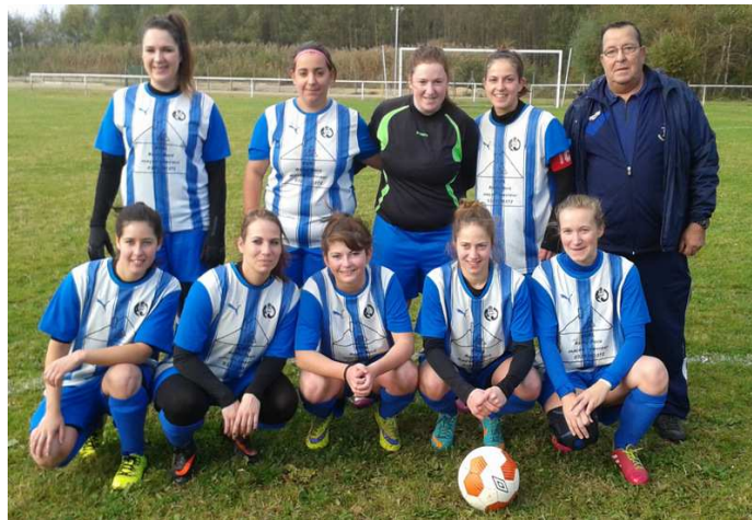
L'équipe féminine de Saint-Aubin