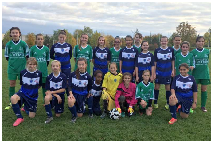
Rencontre de secteur.